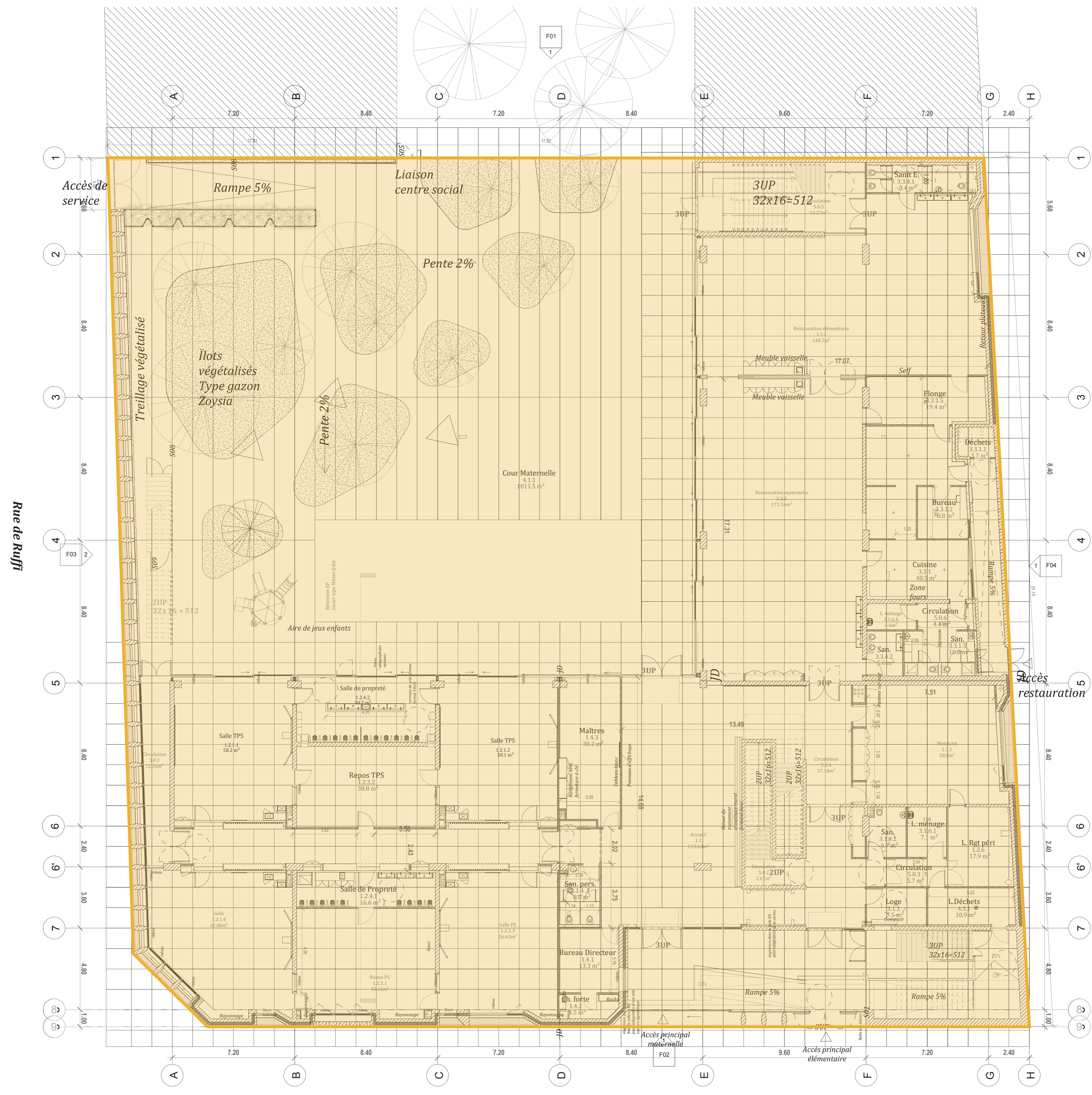
RU4A-P01 PLAN RDC 1 : 100