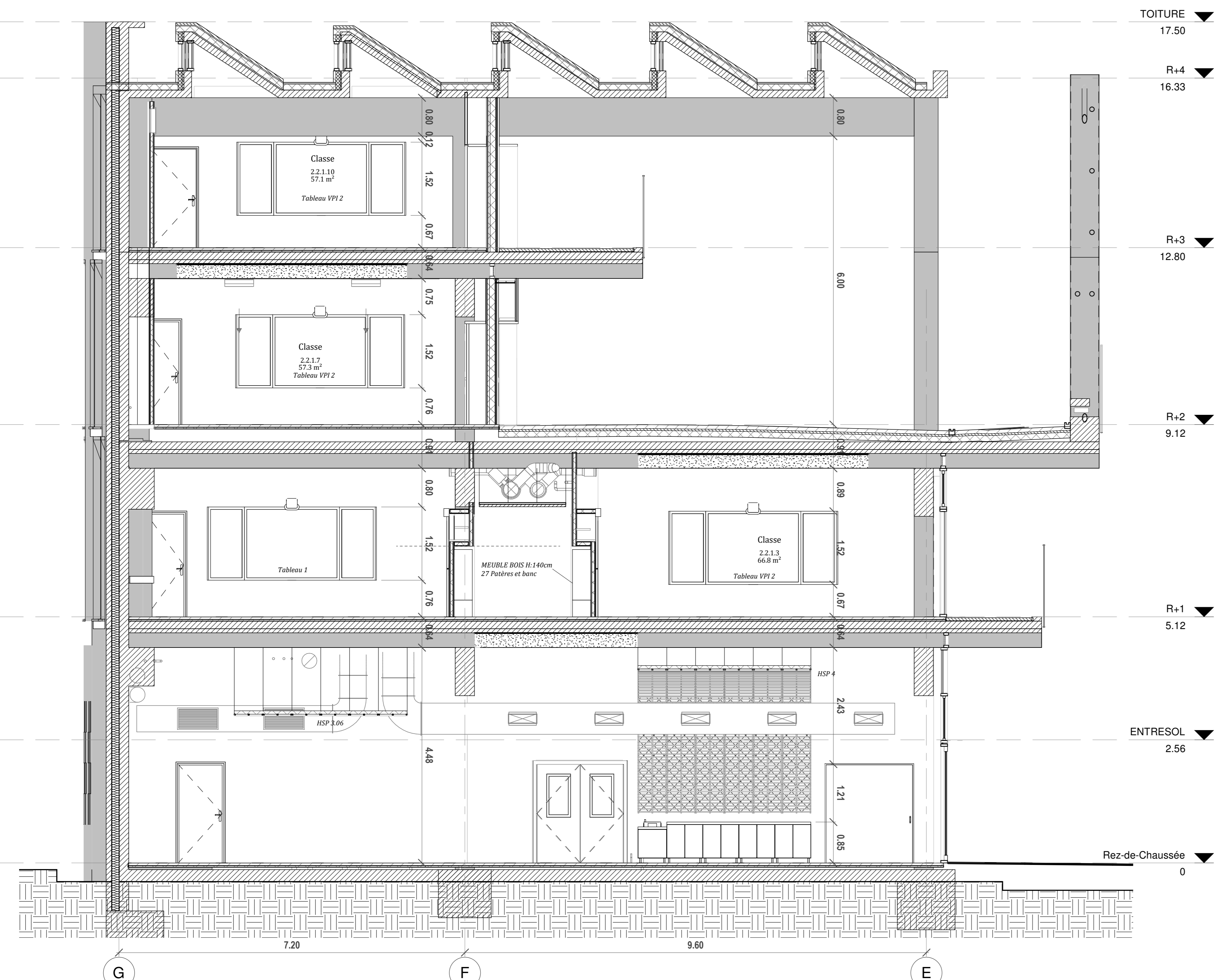
COUPE 14 1 : 50