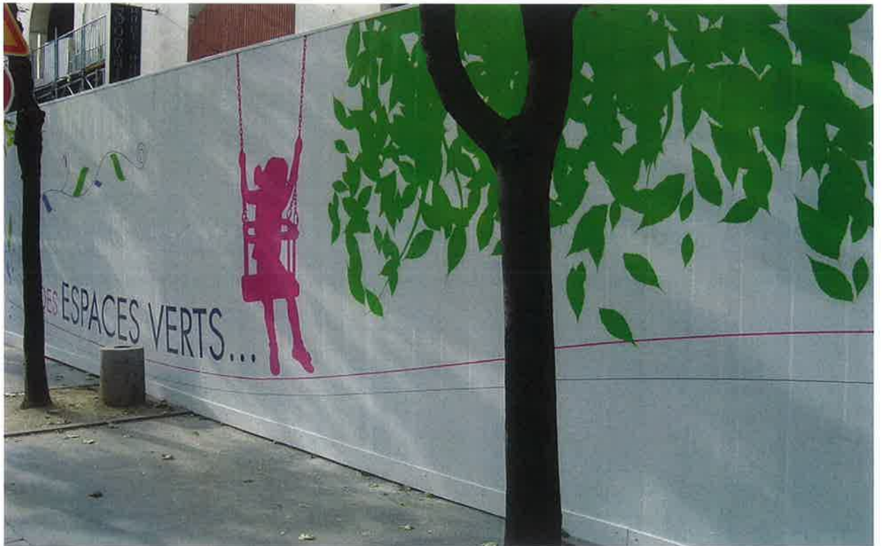
Sur emprise fixe : possibilité d'utilisation de lames à adhésiver (type panorama ou équivalent)

Handwritten signature or mark in blue ink.