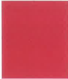
violet bigarreau 7872