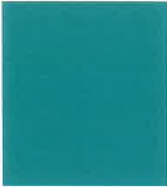
Bleu lèze 7985